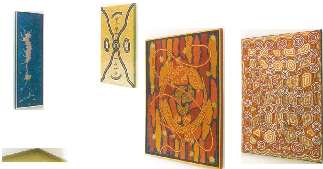
il. 2. Wystawa Sztuka Aborygenów, malarstwo kropkowe i obrazy na korze, 26 X-18 XI 2001, Galeria R, Poznań

Historia kolonizacji brytyjskiej — czy raczej inwazji, jak twierdzą Aborygeni — była krótka i brutalna. Na skutek „kontaktu” wiele szczepów wschodnich wybrzeży Australii uległo szybkiemu wyniszczeniu, a na Tasmanii, wyspie oddalonej o 300 km na południe od kontynentu, tubylcy zostali wybici niemal do nogi w ciągu 30 lat od założenia tam pierwszej kolonii. Jednak ogrom przestrzeni tego kontynentu spowodował, że niektóre szczepy, zamieszkujące trudno dostępne i odizolowane tereny centrum, Ziemi Arnhema i rejonu Kimberley, żyły w kulturze kamienia łupanego jeszcze w drugiej połowie XX wieku (il. 1). To właśnie tam, gdzie przetrwała tradycja i zachowały się pierwotne języki, nastąpił renesans kulturowy: zostały odnowione formy sztuki i odrodziła się twórcza pasja. Sztuka stała się szybko ważną formą podtrzymywania i przekazywania tradycji, nieodłącznym środkiem promocji kultur aborygeńskich poza granicami Australii, jak również istotnym źródłem dochodów dla artystów i ich rodzin.