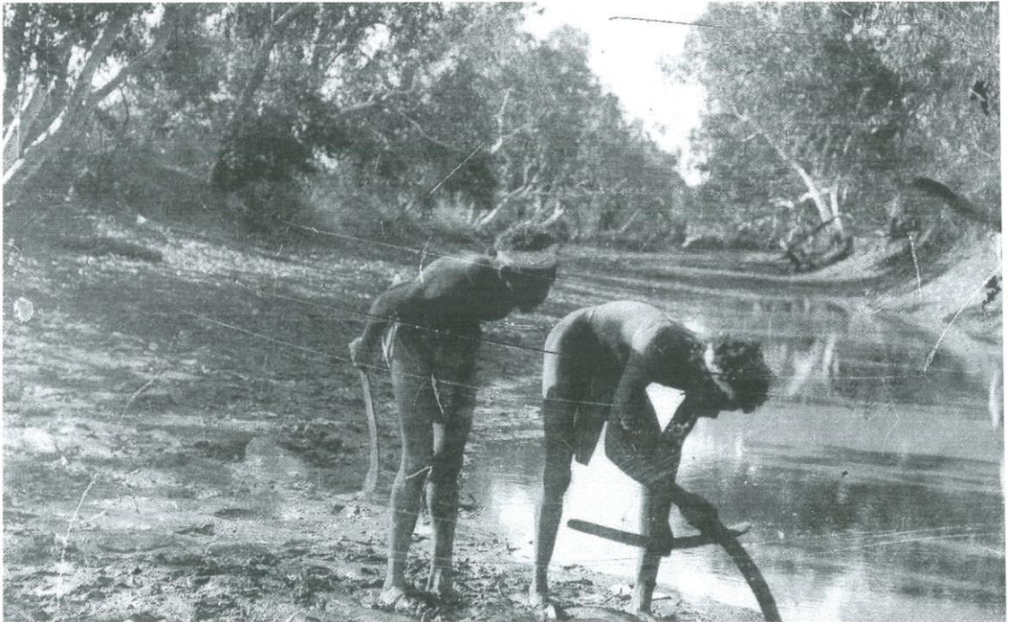
il. 1. Myśliwi wypatrują śladów zwierząt w wyschniętym korycie rzeki, Australia Centralna, lata 50. XX wieku.

Australijscy Aborygeni są niewątpliwie jednym z najbardziej znanych z nazwy, ale chyba najmniej poznanych i zrozumianych ludów na świecie. Posiadają imponującą tradycję kulturową, a jednocześnie oddziela ich od nas ogromna przepaść cywilizacyjna. Niektórzy z nich żyli w kulturze kamienia łupanego jeszcze w czasie, kiedy pierwszy człowiek lądował na Księżycu! Aborygeńska kultura jest jedną z ostatnich, jeżeli nie ostatnią, kulturą paleolitu (starsza epoka kamienia), której udokumentowane ślady liczą sobie co najmniej 60 tysięcy lat. Najnowsze wykopaliska archeologiczne z rejonu Kimberley (stan Zachodnia Australia) pozwalają przypuszczać, że pojawienie się tubylców na kontynencie australijskim mogło nastąpić już ponad 100 tysięcy lat temu, podając tym samym w wątpliwość wiele założeń antropologicznych i podważając popularną koncepcję ewolucji człowieka.